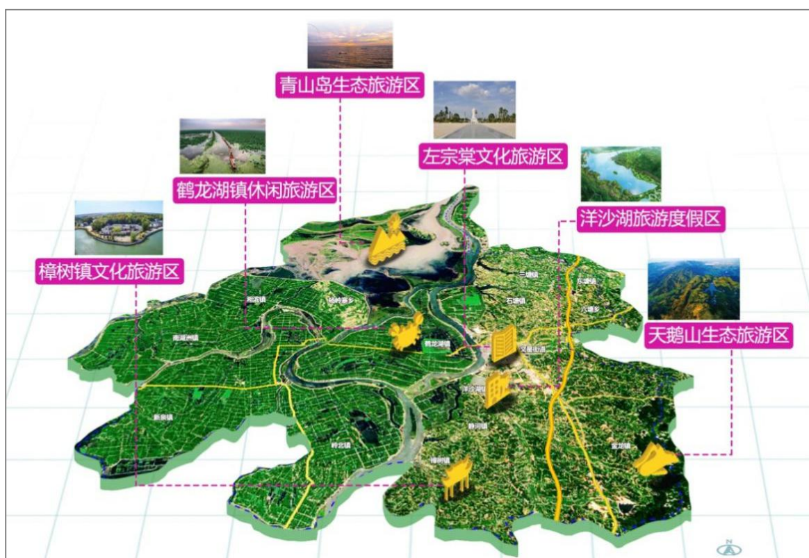
专栏 4-3：文化旅游产业功能片区结构表