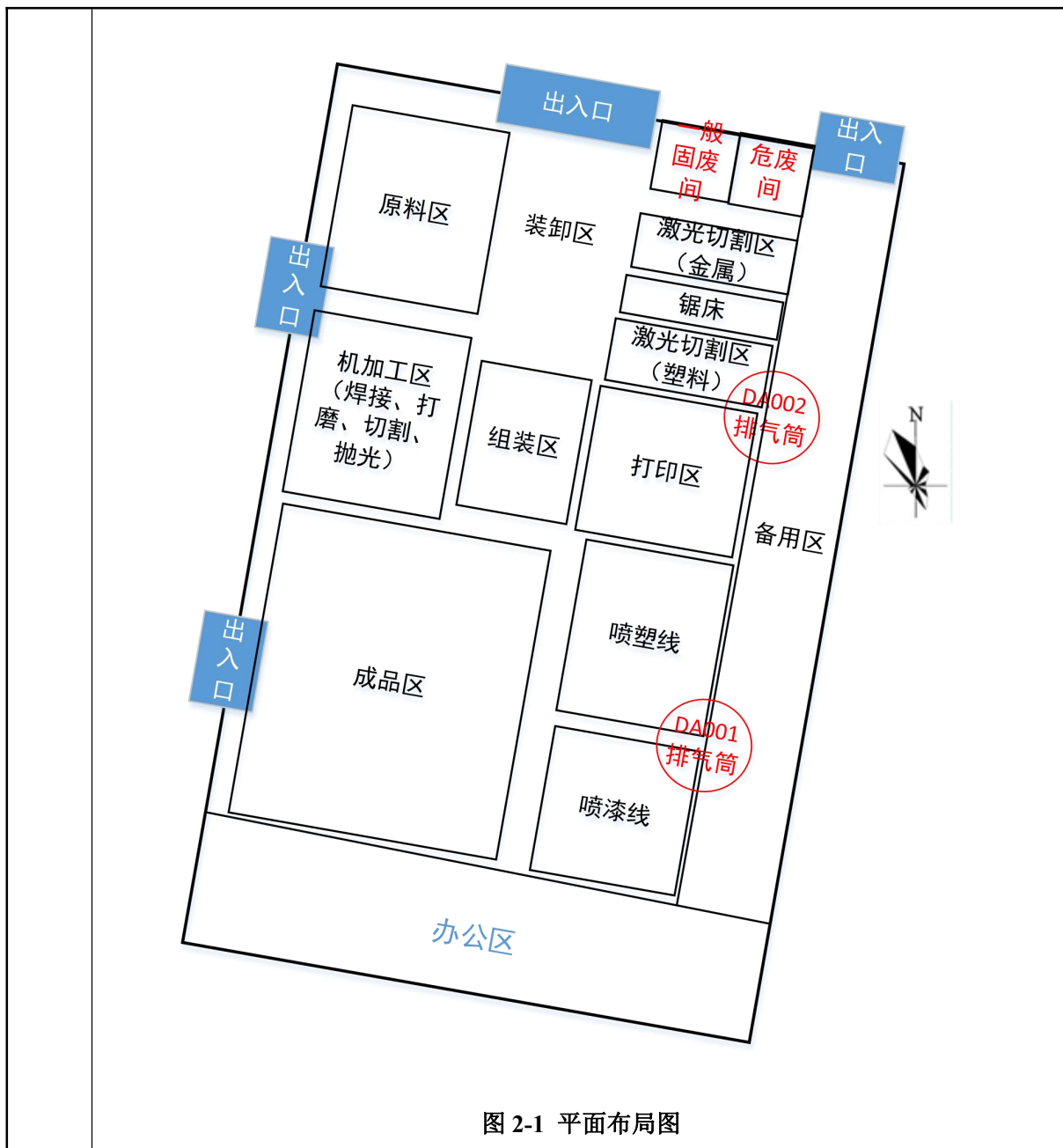
图 2-1 平面布局图