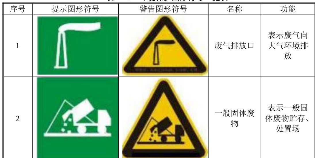
表 4-16 环境保护图形符号一览表